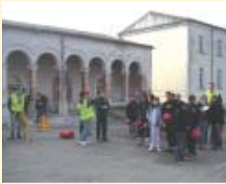
Cobaty Aude organise une nouvelle fois sa grande manifestation annuelle « Construire demain : de l'apprenti à l'ingénieur »...