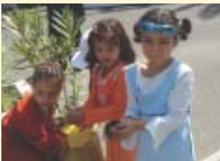
Cobaty Maroc : une ville éducatrice