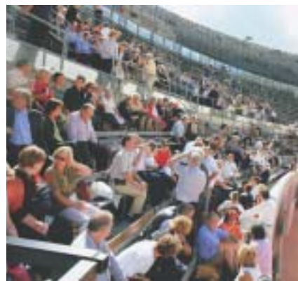
Course de taureaux dans les arènes