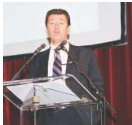
M. Christian Estrosi, Ministre de l'Aménagement du Territoire

hommage au Maire de Nîmes, « pour ses talents de bâtisseur » et s'est félicité du thème choisi pour ce Congrès. « Il s'agit d'un sujet passionnant : marché vers l'avenir sur les pas de l'histoire ! Je veux valoriser notre premier patrimoine : le patrimoine humain. C'est pourquoi j'ai mis en place les pôles de compétitivité qui devraient à terme être au nombre de 70 et permettre la valorisation de la recherche industrielle en France ».