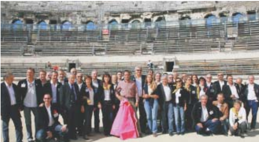
L'équipe organisatrice dans les arènes

modifications en petites modifications, le projet fini par être écarté ! » Pour JP Volle, les propos des intervenants « démontrent bien que les trésors subis sont récupérés comme élément de modernité. Nous avons souvent une vision figée du passé. Mais le grand défi est bien de dépasser cette conception ».