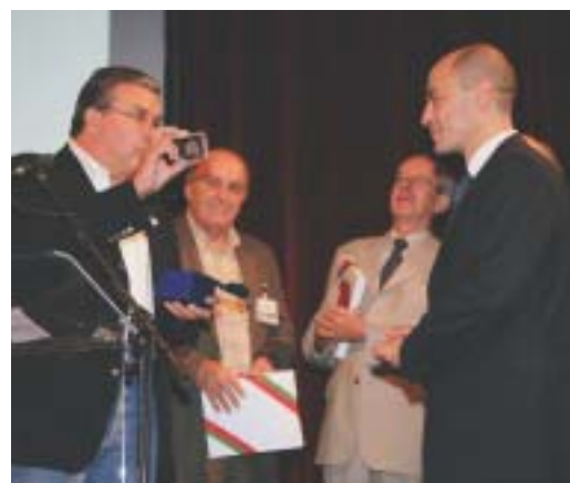
Remise de la médaille de la ville de Nîmes au Consul du Liban par le Maire.