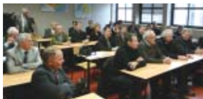
Une assemblée très studieuse

Les Cobatystes au grand complet ont été studieux, plus que jamais motivés et créatifs pour bien vous accueillir en octobre 2009 !