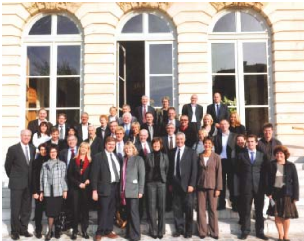
L'importante délégation de Cobaty Haute-Savoie sur le perron de l'Hôtel de Lassay

A 17 heures, c'était au tour de Jean-Claude Carle, sénateur de Haute-Savoie, de recevoir la délégation au Palais du Luxembourg pour la visite du Sénat : la Salle des Conférences, la Bibliothèque, l'Hémicycle et, enfin, la Questure où une réception digne des lieux attendait les Cobatystes.