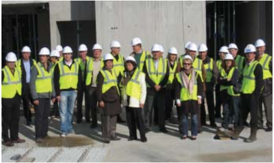
Les Cobatystes de la Mayenne sur le chantier HQE du lycée Tabarly

C'est le 23 octobre 2008 que les Cobatystes de La Mayenne se sont retrouvées pour leur sortie annuelle sous le soleil des Sables d'Olonne en Vendée.