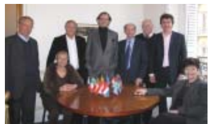
Les membres de la Commission "Citoyenneté" au complet...

- nous sommes les témoins les uns pour les autres de notre implication pour retisser le lien social et renouveler le sens de ce que nous faisons dans l'exercice de nos métiers. ●