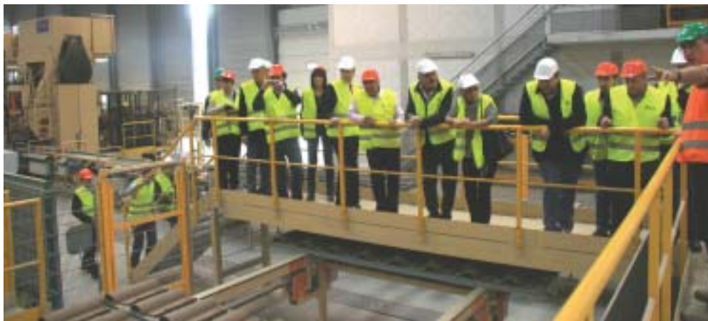
Une visite captivante pour les Cobatystes de Haute-Loire et de Carcassonne

Des contacts sont noués, des amitiés sont nées... Promis, juré, Cobaty Carcassonne montera prochainement à l'assaut des collines de Haute-Loire... ●