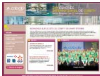
Notre site internet, vite une visite!

C'est tout simple...sur le site de Cobaty cliquez sur le lien "Congrès 2009 à Saint-Etienne". ●