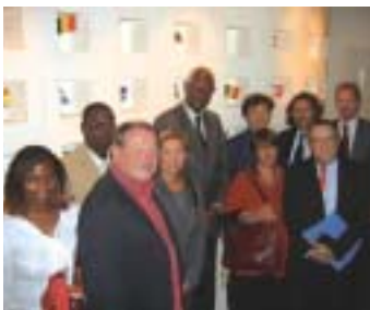
Réception de Cobaty International par le Secrétaire Général AbdouDiouf

Cobaty International et la Francophonie 11