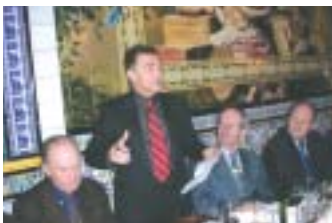
Conseil d'administration à Valencia