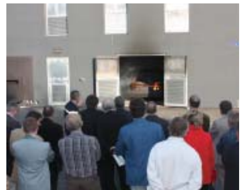
Les exercices ont passionné...

mandant Horeau ont accueilli les Cobatystes avec gentillesse et la fierté de présenter aux professionnels du bâtiment leur centre d'entraînement, certainement un des plus en pointe à ce jour.