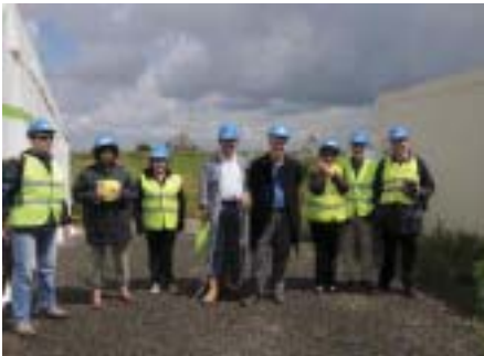
Visite d'un chantier exceptionnel