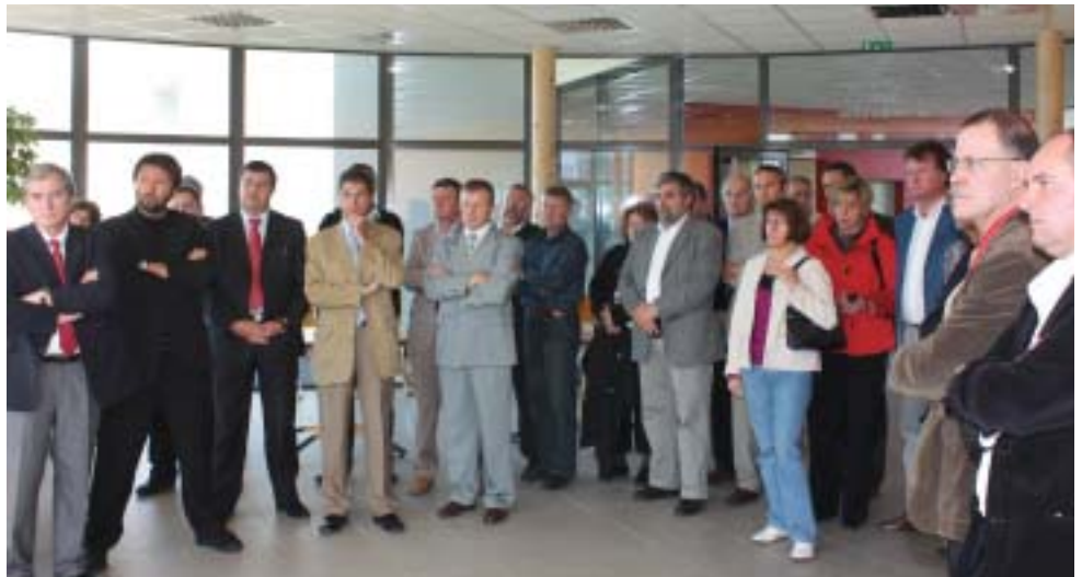
Accueil des 28 Cobatystes par le Directeur de la Maison à feu

L'école comprend des salles de cours, documentation, administration, réunions. Son originalité tient aux équipements spécialement créés et installés pour mettre les stagiaires dans les conditions réelles de leur métier.