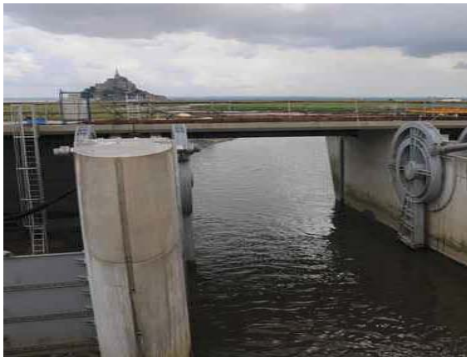
Une des huit vannes du nouveau barrage sur le Couesnon