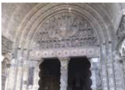
Le tympan de l'abbatiale...

Grâce à une organisation sans faille des