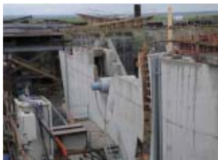
Le chantier du barrage

Nul doute que désormais les Cobatystes suivront avec attention le déroulement des travaux et, pourquoi pas ?, organiseront à nouveau des visites sur place.