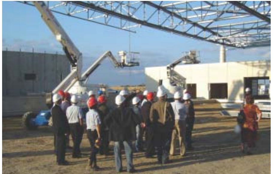
Les Cobatystes ont pu découvrir l'état des travaux de la charpente métallique

Dans sa partie sportive, il abritera : un bassin olympique avec un mur mobile qui permettra de pratiquer la natation synchronisée, le water-polo, un bassin de plongée de 3,50 m et 6 m associé à