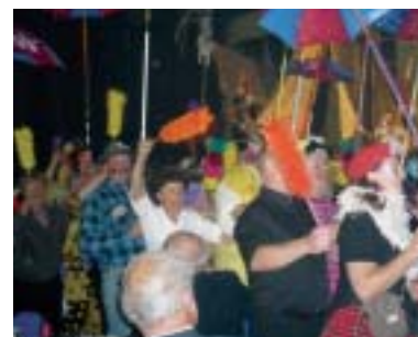
Dimanche 28 septembre/0h30 : la folle ambiance de la Soirée Carnaval...