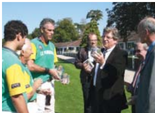
Remise de la coupe Cobaty...

Un franc succès : plus de 110 invités ont partagé cette prestigieuse journée, de plus particulièrement ensoleillée. Et tous ont émis le souhait de faire partie des heureux élus pour le prochain gala de 2009.