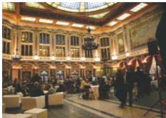
Jeudi 25 septembre/21h00 : Soirée d'accueil à la CCI Grand Lille en présence de Bruno Bonduelle, son Président