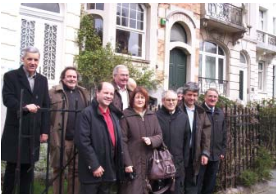
Deux jours passionnants pour une délégation passionnée