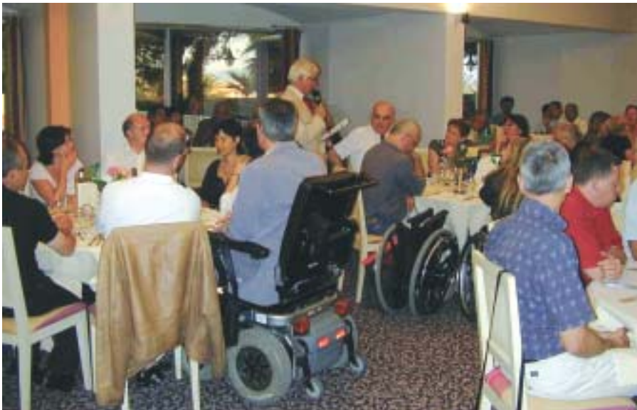
Objectif : rendre possible à toutes personnes handicapées l'accès à tout type de bâtiment

Pour atteindre ces deux objectifs, il faudra accomplir un travail de réflexion et de proposition provenant de tous les acteurs concernés par le "vivre ensemble" (entreprises, communes, villes, départements, régions, Etat), notamment ceux du bâtiment, pour rendre possible à toute personne handicapée l'accès à tout type de bâtiment (neuf ou ancien, individuel ou collectif).